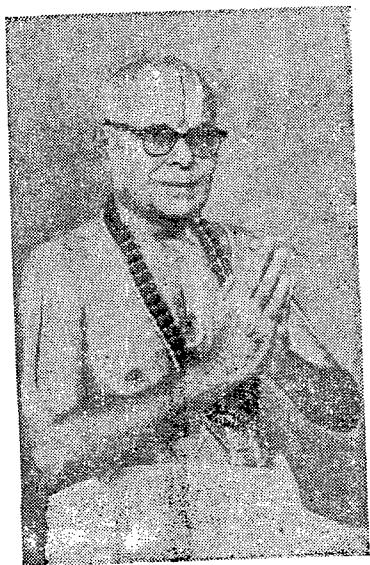
ஸ்ரீ. உ. வே. வித்வான்.